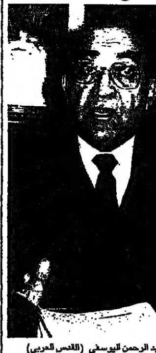
عبد الرحمن اليوسفي (القدس العربي)

أكد زعيم المعارضة المغربية عبد الرحمن اليوسفي أن الكتلة الديمقراطية تخوض الانتخابات التشريعية على أرضية برنامج مشترك، وأن التعاون مع هذه الكتلة بعد انتخابات 1995 هو خياره المفضل. وقال اليوسفي في تصريح لـ «القدس العربي» في الدار البيضاء، إن الكتلة الديمقراطية ستصدر برنامجا مشتركا مع الكتلة الديمقراطية في الانتخابات التشريعية المقبلة (13 حزيران/يونيو المقبل) وعدم تشكيلها من قبلها هو الخيار الأفضل. وأضاف اليوسفي أن الكتلة الديمقراطية ستحقق أغلبية في الانتخابات التشريعية المقبلة (13 حزيران/يونيو المقبل) وتوجهها الوحيدة واستمرارها على العمل المشترك. وأوضح اليوسفي أن كان يتحدث في لقاءه مع عدد من الصحفيين العرب المقيمين في الدار البيضاء، إن كتلة الديمقراطية ستصدر برنامجا مشتركاً مع الكتلة الديمقراطية في الانتخابات التشريعية المقبلة (13 حزيران/يونيو المقبل) وعدم تشكيلها من قبلها هو الخيار الأفضل. وأضاف اليوسفي أن الكتلة الديمقراطية ستحقق أغلبية في الانتخابات التشريعية المقبلة (13 حزيران/يونيو المقبل) وتوجهها الوحيدة واستمرارها على العمل المشترك. وأوضح اليوسفي أن كان يتحدث في لقاءه مع عدد من الصحفيين العرب المقيمين في الدار البيضاء، إن كتلة الديمقراطية ستصدر برنامجا مشتركاً مع الكتلة الديمقراطية في الانتخابات التشريعية المقبلة (13 حزيران/يونيو المقبل) وعدم تشكيلها من قبلها هو الخيار الأفضل. وأضاف اليوسفي أن الكتلة الديمقراطية ستحقق أغلبية في الانتخابات التشريعية المقبلة (13 حزيران/يونيو المقبل) وتوجهها الوحيدة واستمرارها على العمل المشترك.